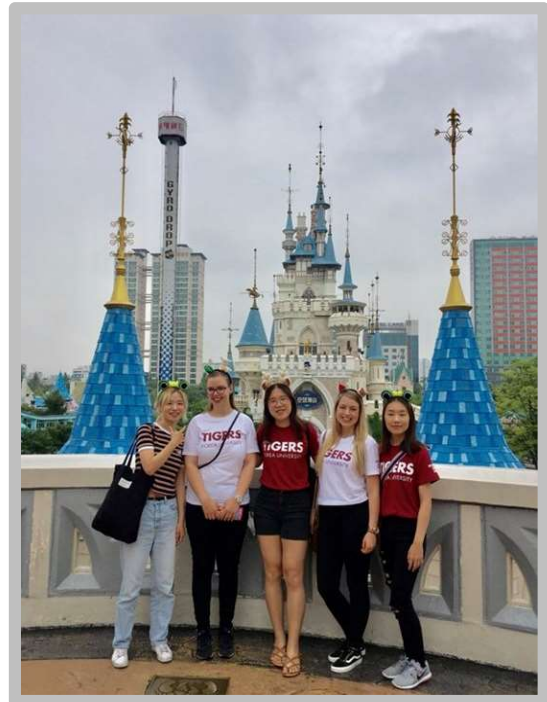
Lotte World vidámpark

Az egyetem által biztosított programokon felül egyik csoporttársammal indultunk felfedezni a fővárost, Szöult. Elmondható, hogy a város sosem alszik, mindig van valamilyen program, amin részt lehet venni.