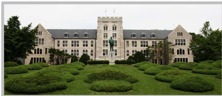
A Korea University főépülete

Már régóta érdekelt a koreai kultúra, ezért amikor egyetemi tanulmányaimat megkezdtem, párhuzamosan a koreai nyelvet is elkezdtem tanulni. Először önállóan tanultam, majd az OBIC által meghirdetett órák keretében.